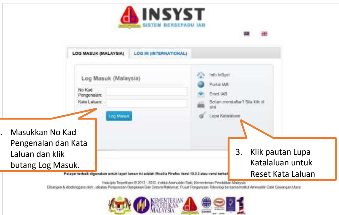
Gambar 2: Log Masuk INSYST